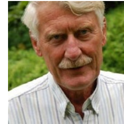
Akademik Svein Mønnesland Univerzitet u Oslu